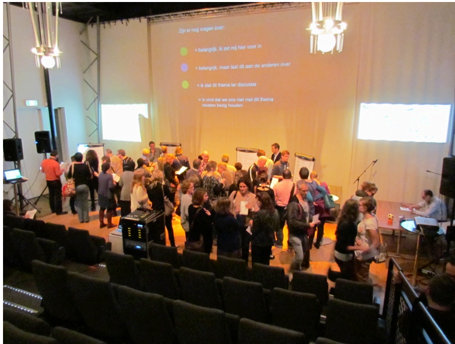
Een overzicht van het stickeren voor een project voor de huisvesting van dak- en thuislozen.